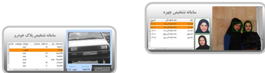
شکل ۳- نمونه‌ای از قابلیت‌های آنالیتیک نرم‌افزار جامع محتوی ویدیویی امن پایش